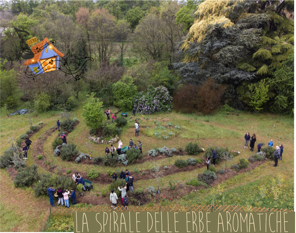
LA SPIRALE DELLE ERBE AROMATICHE